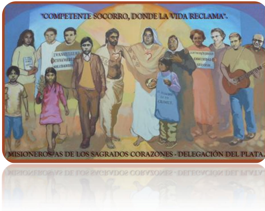
FOTO DE FAMILIA